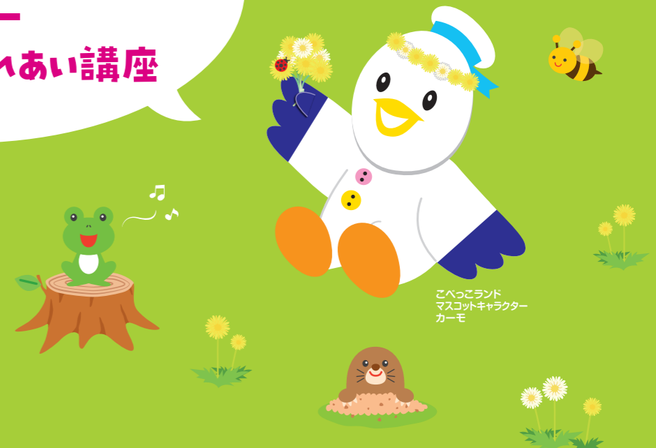
こべっこランド マスコットキャラクター カーモ